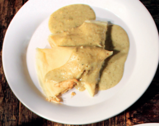
OMELETTE TOCINO Tocino, champiñones frescos, queso gouda y parmesano