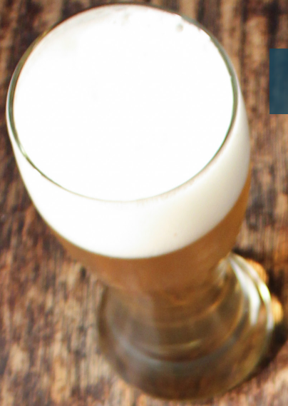
CERVEZA De Barril