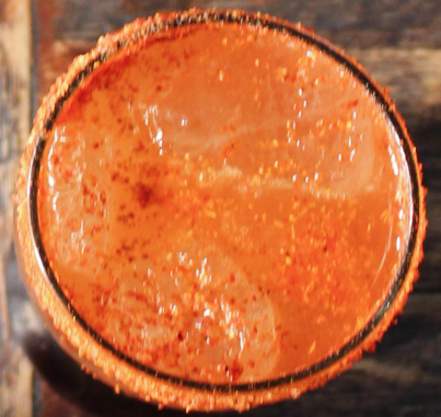
MICHELADA Cerveza clara y sabor mango