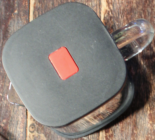
TÉ Tetera de Menta Marroquí