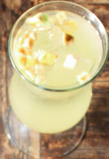
COCTÉL Clericot verde extravaganza