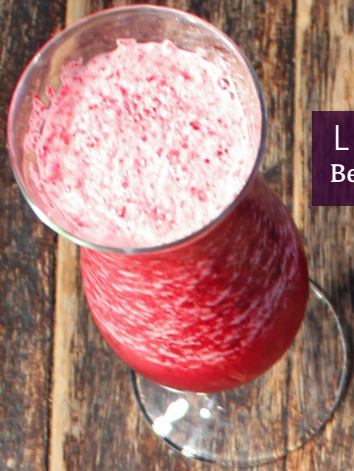
LLUVIA PÚRPURA Betabel y limón