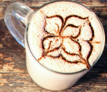
CHOCOLATE Regular con leche