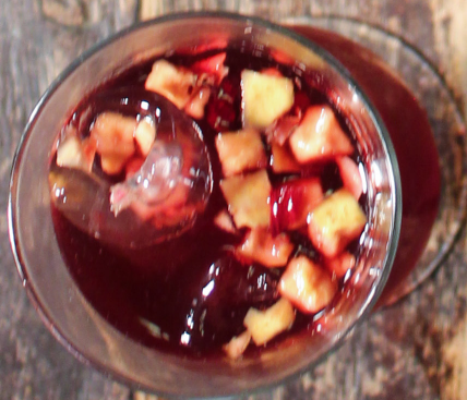
COCTÉL Clericot pasión y petalos