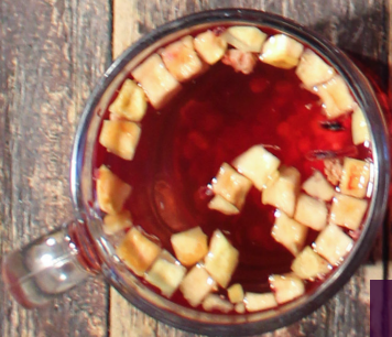
TISANA Taza de moras