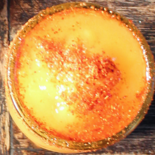
SMOOHIE Mango con chile